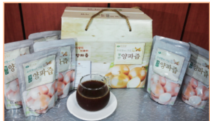
양파즙 1박스(30포) 판매가격 : 18,000원