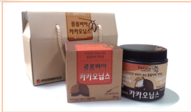
파머스가든 콜롬비아 카카오닙스-Big Nibs 콜롬비아 카카오닙스 250g x 2병 판매가격 : 18,000원 (VAT 별도)