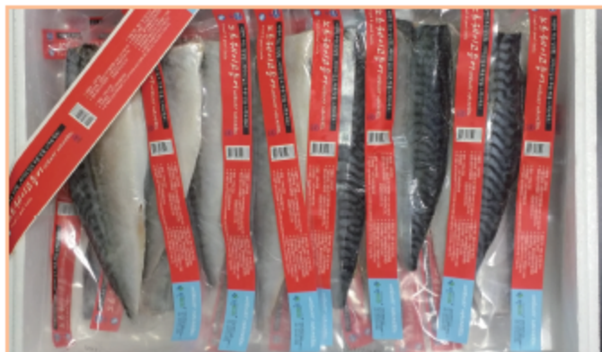
노르웨이 고등어 20쪽 판매가격 : 39,000원