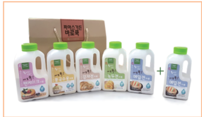
파머스가든 바로크 세트 바로크 메밀전가루 120g x 2병, 바로크 녹두전가루 145g x 1병 바로크 감자전가루 140g x 1병, 바로크 콩국수용가루 125g x 1병 바로크 팬케이크가루 215g x 1병 판매가격 : 12,500원 (VAT 별도)