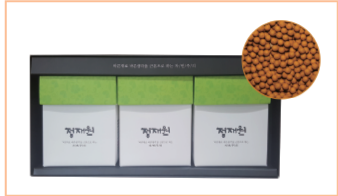
강환환선물세트 (3g×30stick)×3box 판매가격 : 33,000원