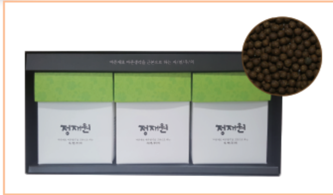
양배추환선물세트 (3g×30stick)×3box 판매가격 : 33,000원